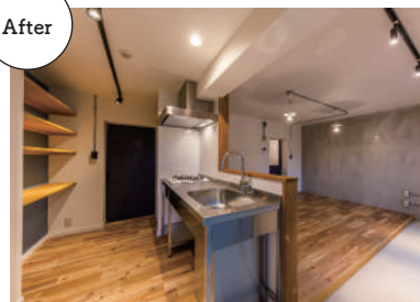
リノベーション後、内覧がすぐに入り、なかなか埋まらなかった空室が即満室に改善。