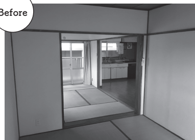
築41年。古く使い勝手の悪い3DKの部屋