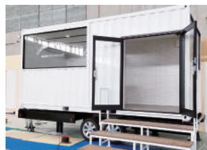
●店舗用トレーラーハウス